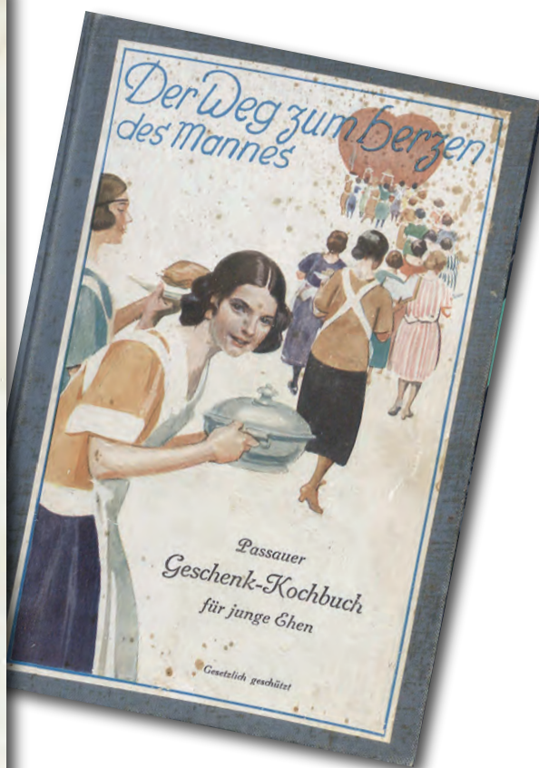
Rechts: Spiegel des Zeitgeistes. „Der Weg zum Herzen des Mannes“ (Staatliche Bibliothek Regensburg, 999/17.605)

Zu Beginn des 19. Jahrhunderts kamen vermehrt Kochbücher in Mode, die sich an die Frauen des Bürgertums richteten. Die Autorinnen waren zumeist selbst Köchinnen, die auf oft jahrzehntelange Erfahrungen zurückblicken konnten, aber auch im Bereich der Frauenbildung tätige Damen. Hinzu kam, dass sich nun auch die Leserschaft veränderte. Eine zunehmend verbesserte Schulbildung einerseits und eine durch neue Drucktechniken ermöglichte Reduzierung der Buchpreise andererseits erschlossen den Kochbüchern nun neue Kreise. Diese Entwicklung ist parallel zum Aufstieg des Bürgertums generell zu sehen. Das 19. Jahrhundert gilt bekanntlich als das „bürgerliche Zeitalter“. Das aufstrebende Bürgertum übernahm nun oft die Essgewohnheiten der höfischen, adeligen Schichten.