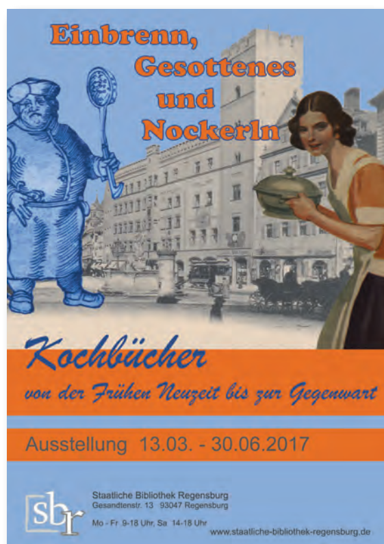
Das Plakat der Ausstellung in der Staatlichen Bibliothek Regensburg

ternets, doch kaum jemand weiß Näheres über die lange Geschichte dieser Textsorte. Eine unterschätzte Erscheinungsform des gedruckten Buches, die zur sogenannten „Verbrauchsliteratur“ zählt. Denn Kochbücher werden benutzt, so lange es geht, oft bis sie auseinanderfallen.